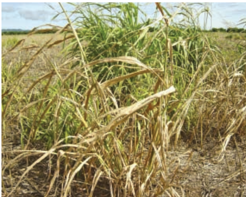
Plantas de sorgo de Alepo en un cultivo de soja tratado con glifosato. Advértase que algunas plantas de la maleza sobrevivieron el tratamiento.

En la Argentina, el uso masivo de plaguicidas coincidió con la expansión agrícola pampeana hacia áreas de bosque chaqueño y otras de pastizales inundables, en las que se implantó una agricultura permanente. También coincidió con la técnica del laboreo reducido de la tierra o siembra directa, en reemplazo del tradicional arado de reja y vertedera que removía el suelo. La siembra directa tuvo el propósito inicial de reducir la erosión del suelo causada por el uso del arado, pero requirió que el control de las malezas de los cultivos se realizase solo con herbicidas, pues quedó eliminada la acción de dar vuelta la capa superficial de suelo por el arado. Asimismo, la di-