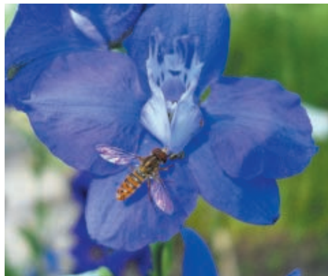
Flor de espuela de caballero o conejito ( Delphinium ajacis ) visitada por una mosca del género Toxomerus . La imagen muestra dos organismos que no constituyen el blanco de los pesticidas pero que pueden verse afectados por la aplicación de estos.

En la Argentina se dispone de poca información sobre el efecto de los plaguicidas en las propiedades biológicas de los suelos, la que tampoco abunda en el resto del mundo. Recientemente se ha evaluado en laboratorio el efecto de tres herbicidas comerciales con metasulfuron-methyl, 2,4D y glifosato como ingredientes activos, muy utilizados en la región pampeana. Se analizaron sus