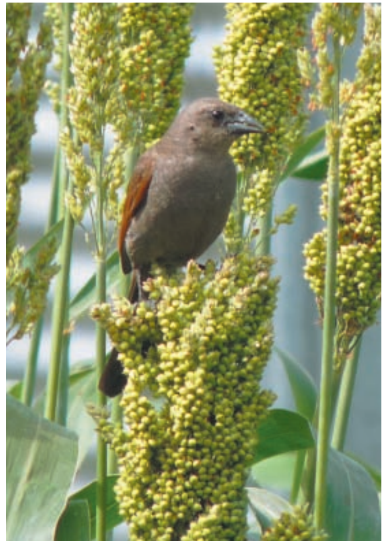
Un tordo músico ( Agelaioides badius ), ave autóctona de la Llanura pampeana, posado sobre una planta de sorgo granífero.

Durante la primera mitad del siglo XX, cuando los pastizales naturales de la región pampeana quedaron definitiva-