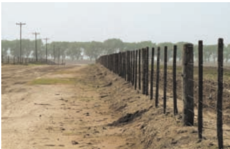
De arriba hacia abajo. Acción del glifosato en el control de la vegetación de las banquetas de caminos y de áreas cultivadas en la pampa ondulada. La primera foto muestra el crecimiento natural de la vegetación; en la segunda se ve un cultivo de trigo (derecha) al borde de un camino desmalezado por acción del glifosato, y en la tercera se aprecia el efecto de la aplicación del herbicida tanto en el camino como en el campo de cultivo.

profundas. Las propiedades del pesticida y del suelo, más las condiciones climáticas definen la probabilidad de que acontezcan estos procesos.