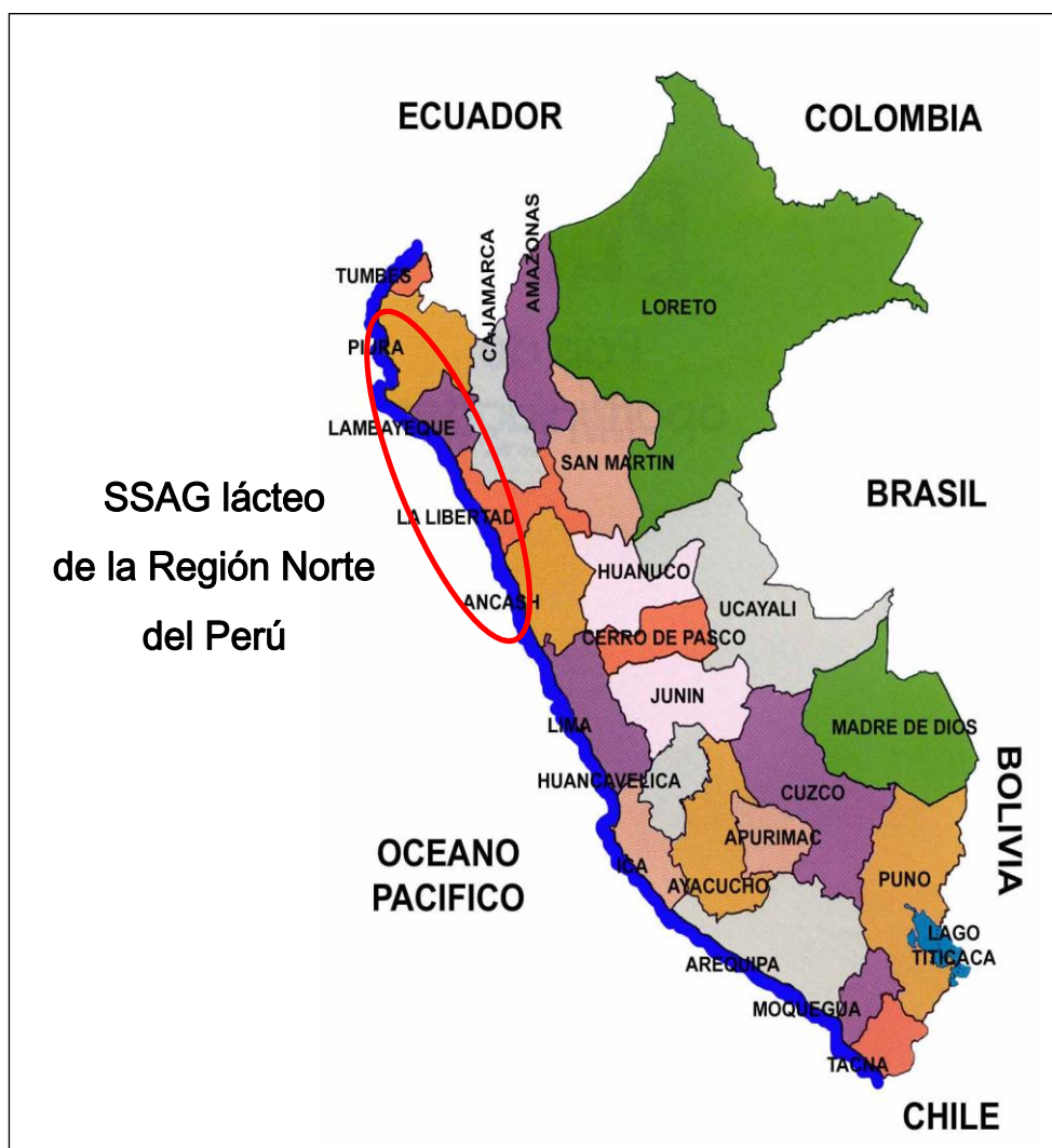
Gráfico 1: Ubicación del SSAG lácteo de la región norte de Perú.

El trabajo de investigación tiene una delimitación temporal y espacial. La delimitación temporal será dentro del contexto de la dinámica del comercio de leche fresca principalmente destinado al mercado nacional durante los años del 2001 a 2014.