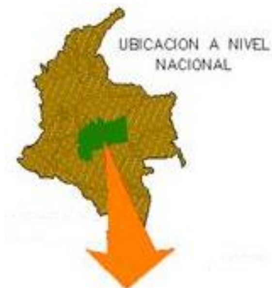
Figura 1. Ubicación departamento del Meta en Colombia.