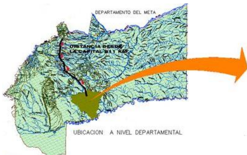
Figura 2. Ubicación municipio de Puerto Rico en el departamento del Meta.