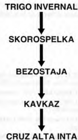
Figura 2. Probables donantes de la resistencia en plántula a oidio en Buck Charrúa