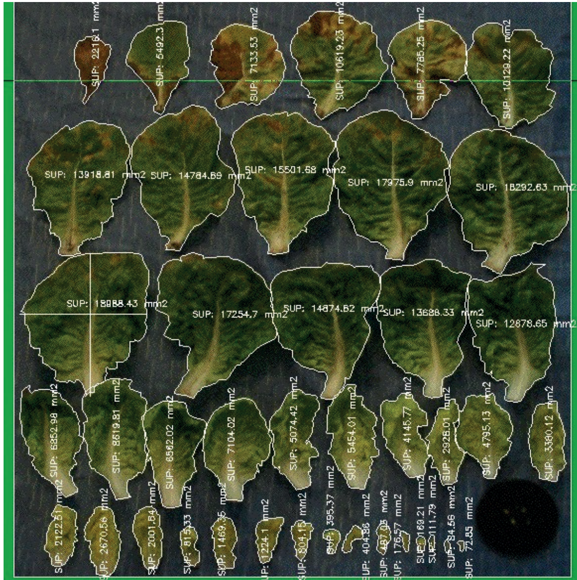
Fotografía 1. Planta representativa de la patología con 10 hojas afectadas y 14,4 dm 2 de superficie foliar afectadas. Se descartaron las tres primeras hojas.