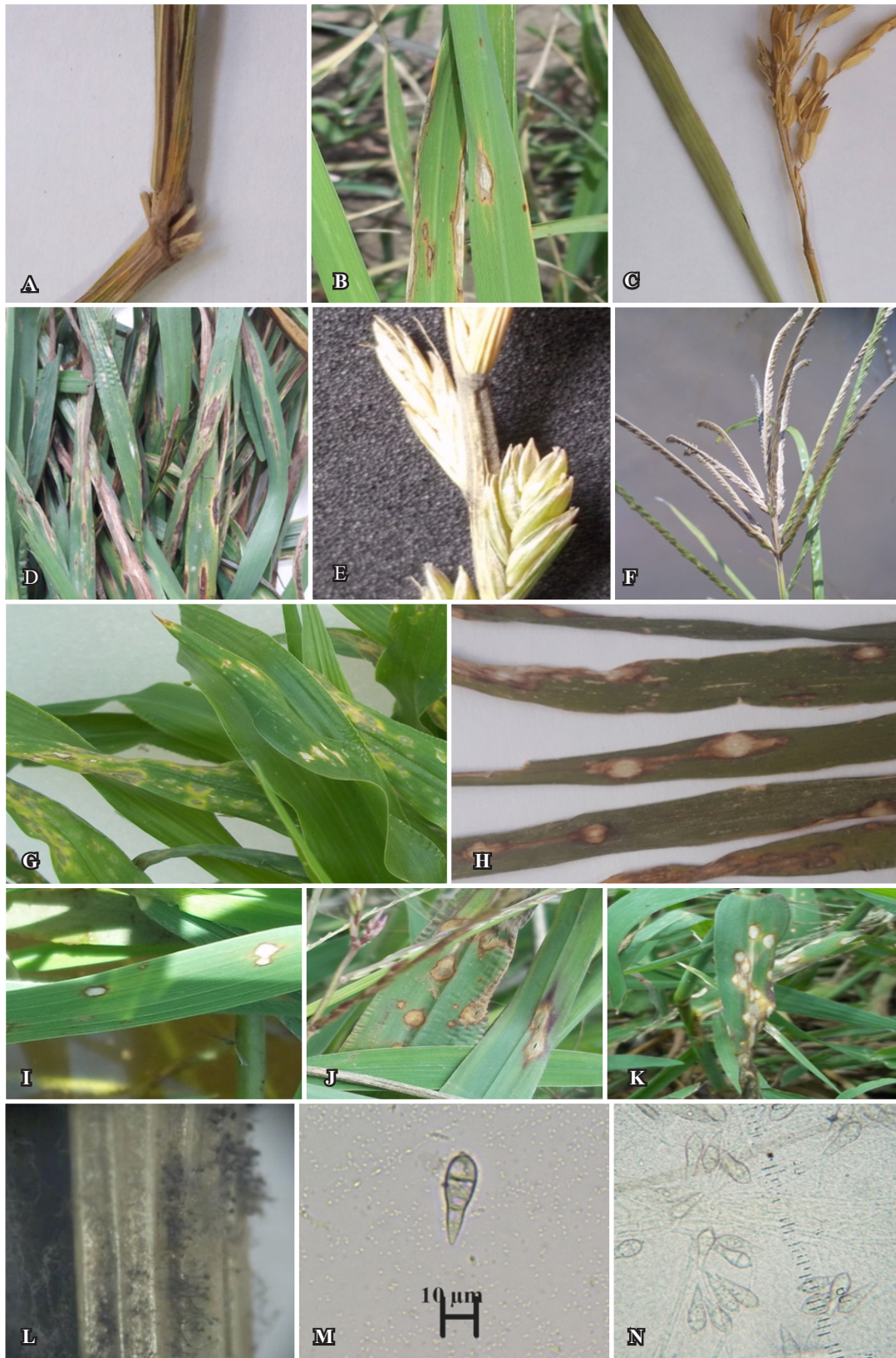
Figura 1. Síntomas causados por Pyricularia spp. Lesiones en condiciones de infección natural en lígula, lámina foliar y cuello de panoja de O. sativa var. GURÍ INTA CL (A, B, C), lámina foliar de B. catharticus (D), Urochloa sp. (G), S. italica (H), L. peruviana (I) y Digitaria sp. (J, K), raquis de L. perenne (E) y E. indica (F). Micelio, conidios y conidióforos en cuello de inflorescencia de E. indica inoculado con aislado de B. catharticus (L), Conidio de aislado de A. sativa (M), medición de conidios en sustrato natural de O. sativa var. GURÍ INTA CL 40x factor de conversión 2,8 (N).