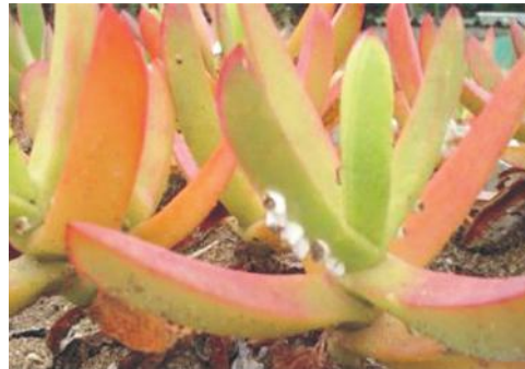
Figure 3. Plantation of Carpobrotus acinaciformis - plots "extensive" and "intensive".