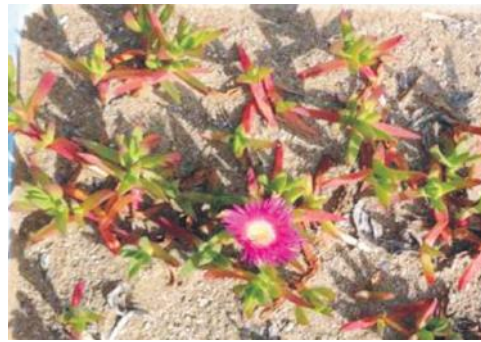
Figura 4. Detalle de Carpobrotus acinaciformis creciendo en las parcelas (fuente propia).