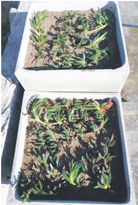
Figura 3. Implantación de Carpobrotus acinaciformis - parcelas "extensiva" e "intensiva".